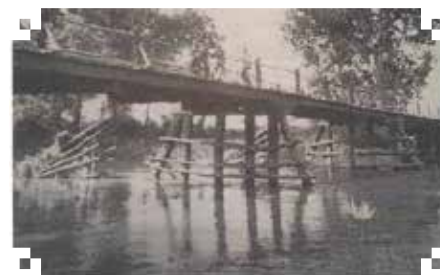
A fahidakat az árvizek és a téli jég-

Jelenlétük alatt a pálosok több hídát is építettek. Az egyiket Mohi és Köröm közé, a körömi fogadójuk közelébe. Ezen át a helyet rövidebben és könnyebben tudták megközelíteni. Ez ellen Zathureczky László, a diósgyőri koronaauradalom provizora (tisztartója, intézője) a vármegye előtt tiltakozott is. Tiltakozása oka az volt, hogy a pálosok azon maguknak szedték a vámot, s ezzel sértették a koronaauradalom anyagi érdekeit.